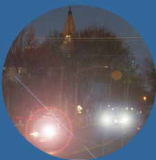
Halos alrededor de las luces