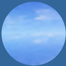
Aumento repentino en manchas ( puntos y/o hilos oscuros como de telarañas ) que flotan adelante de los ojos

Los cambios en la visión debido a enfermedades oculares relacionadas con la diabetes generalmente afectan a ambos ojos. Estos son algunos síntomas a los que debe prestar atención: