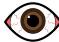
Ojos saltones (llamados proptosis) y retracción de los párpados, que dan una mirada fija o sorprendida