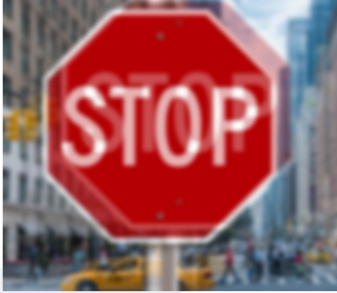
La visión doble puede ser un síntoma de la enfermedad ocular tiroidea.

tener hipotiroidismo. La severidad de los síntomas oculares no está relacionada con la severidad del hipertiroidismo.