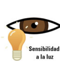
Sensibilidad a la luz